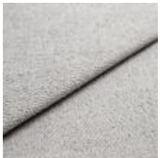
Sealife 363605 Light grey 1029313