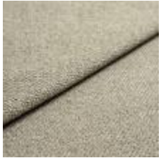
Sealife 363606 Green/white 1029307