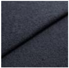
Sealife 384932 Marine 1029301