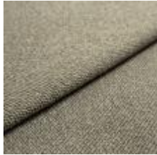
Sealife 363611 Green/black 1029308