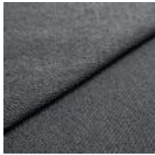
Sealife 384933 Petrol 1029302