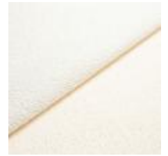
Sealife 363609 Ivory/white 1029306