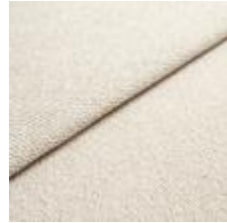
Sealife 363608 Light beige/white 1029310