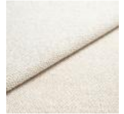
Sealife 363610 Ivory/sand 1029312