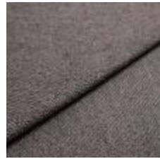
Sealife 384931 Steel 1029304