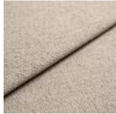
Sealife 363607 Dark beige/white 1029309