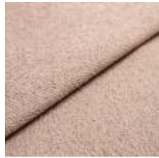
Sealife 384934 Pink 1029303