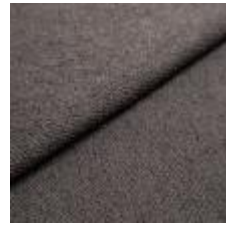
Sealife 384930 Mole 1029305