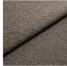
Sealife 363613 Brown/black 1029311