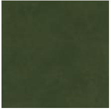
Winston 001 Garden 2042001