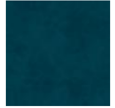
Winston 011 Petrol 2042011