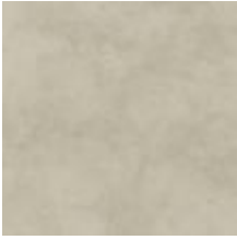
Winston 003 Papyrus 2042003