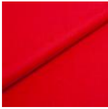
Wooly Plus 2011 B Red 1039015