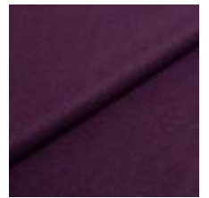
Wooly 2255 dark lilac 91 1038891