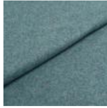
Wooly Plus 2288 Soda 1039024