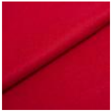
Wooly 2142 raspberry 1 1038801