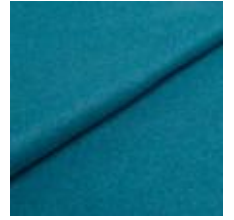
Wooly 2240 petrol 22 1038822