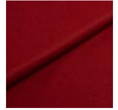
Wooly Trend 2301 Marsala 1039026