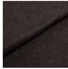
Wooly 1002 koks 4 1038804