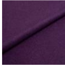
Wooly Plus 0091 Berry 1039017