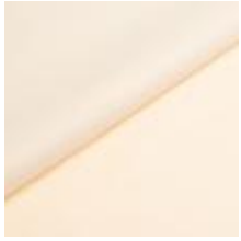
Wooly 1016 bone 10 1038810