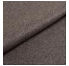
Wooly 1042 grafit 7 1038807