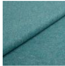
Wooly Trend 22882287 Aquamarin 1039031