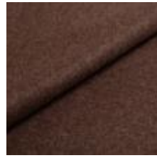
Wooly 1008 brown 6 1038806