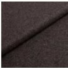
Wooly 1001 antracit 47 1038847