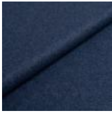
Wooly 2019 marine 2 1038802