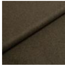
Wooly 1011 bottle green 3 1038803