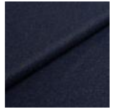
Wooly 1007 navy 42 1038842