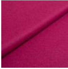
Wooly 1044 cerise 11 1038811