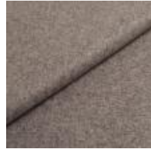
Wooly 1000 light grey 17 1038817