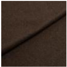
Wooly 1010 forest 23 1038823