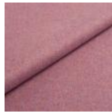
Wooly 2020 lilac melange 81 1038881