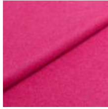
Wooly Plus 9872 Pink 1039016