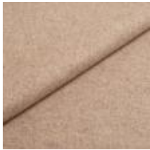
Wooly 2151 beige 26 1038826