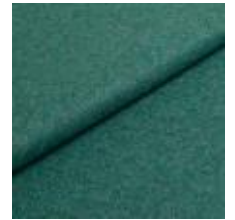
Wooly Trend 842287 Lagoon 1039032