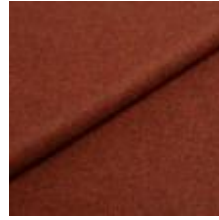
Wooly Trend 380037 Rust 1039025