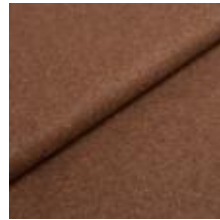
Wooly 1026 light brown 36 1038836