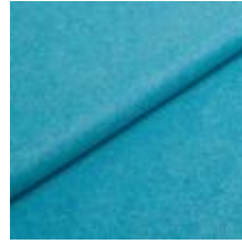
Wooly Plus 0106 Turquoise 1039018