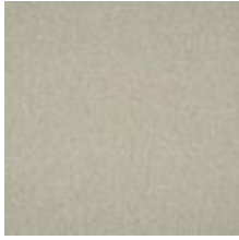
Wave 74A2-1 Champagne 1032811