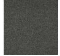
Wave G1G1 Slate 1032815