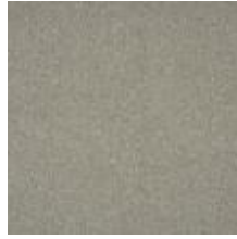
Wave 10A4 Sand 1032812