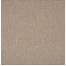
Wave Z7A2 Pink 1032816