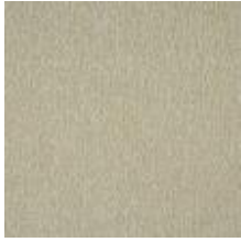
Wave R874 Honey 1032817