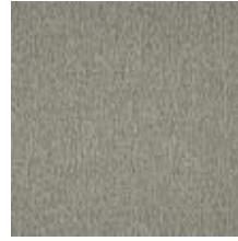
Wave G1A2 Cobblestone 1032814