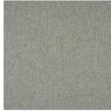
Wave 44A2 Sky 1032818