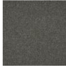
Wave G1B8 Steel 1032813