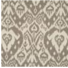
Vicarello col 006 9950042