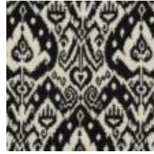
Vicarello col 003 9950046