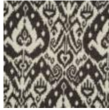
Vicarello col 002 9950044