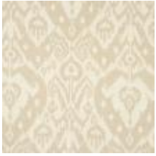
Vicarello col 001 9950040