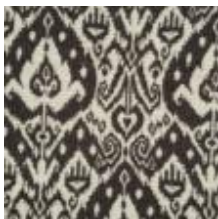
Vicarello col 002 9950044