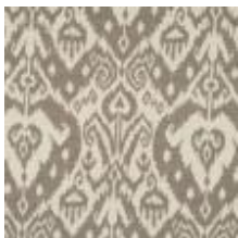
Vicarello col 006 9950042