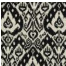
Vicarello col 003 9950046